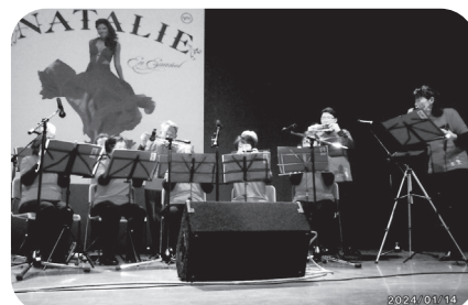
ハデコンコンサート 2024/1/14 ゆう・もあーず