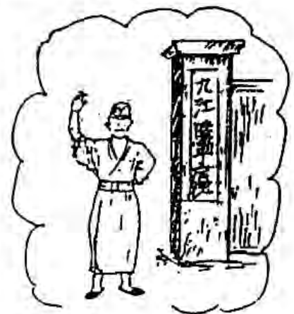
関西ハーモニカ連盟常任顧問 関西ハーモニカポップス会長

そして私が渡したハーモニカは、彼の雑嚢に納められたまゝ遺体と共に焼かれ、中国の土にかえたのである。