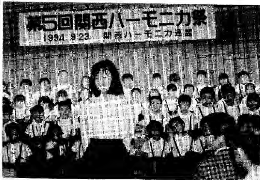
大好きな先生につれられて・・・ みなと幼稚園のみなさん